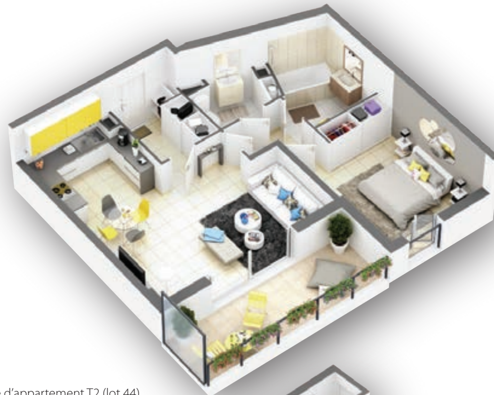
Exemple d'appartement T2 (lot 44) 55,28 m 2 de surface habitable et 10,17 m 2 de terrasse

Double vitrage isolant thermique et phonique Peinture lisse Volets roulants électriques Thermostat individuel Carrelage Grès Cérame 45x45 Sèche serviette dans les salles de bain Grandes terrasses