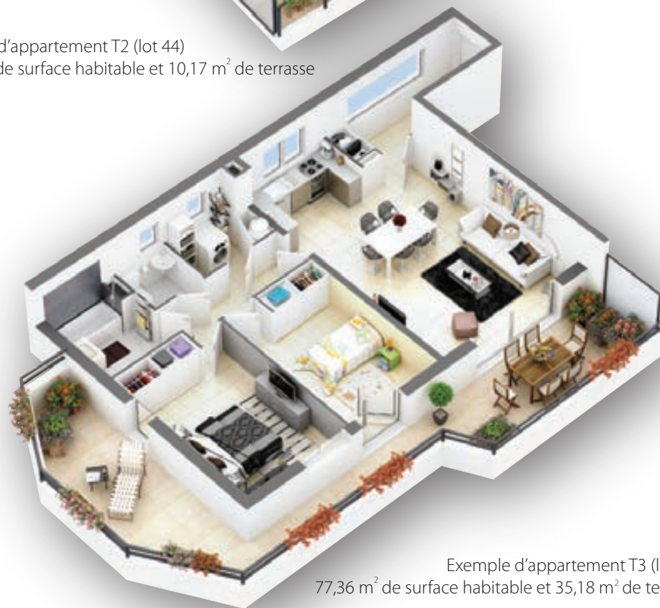
Exemple d'appartement T3 (lot 45) 77,36 m 2 de surface habitable et 35,18 m 2 de terrasse