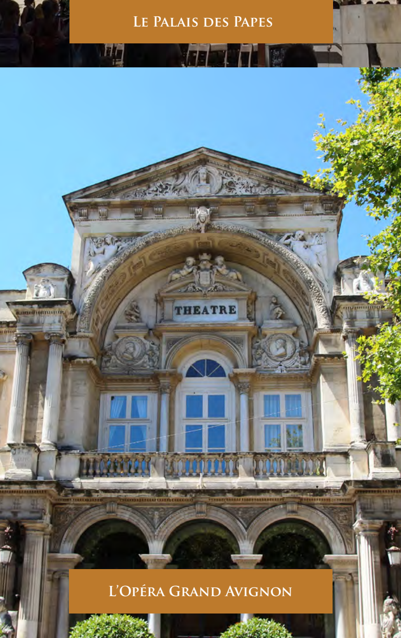
L'OPÉRA GRAND AVIGNON