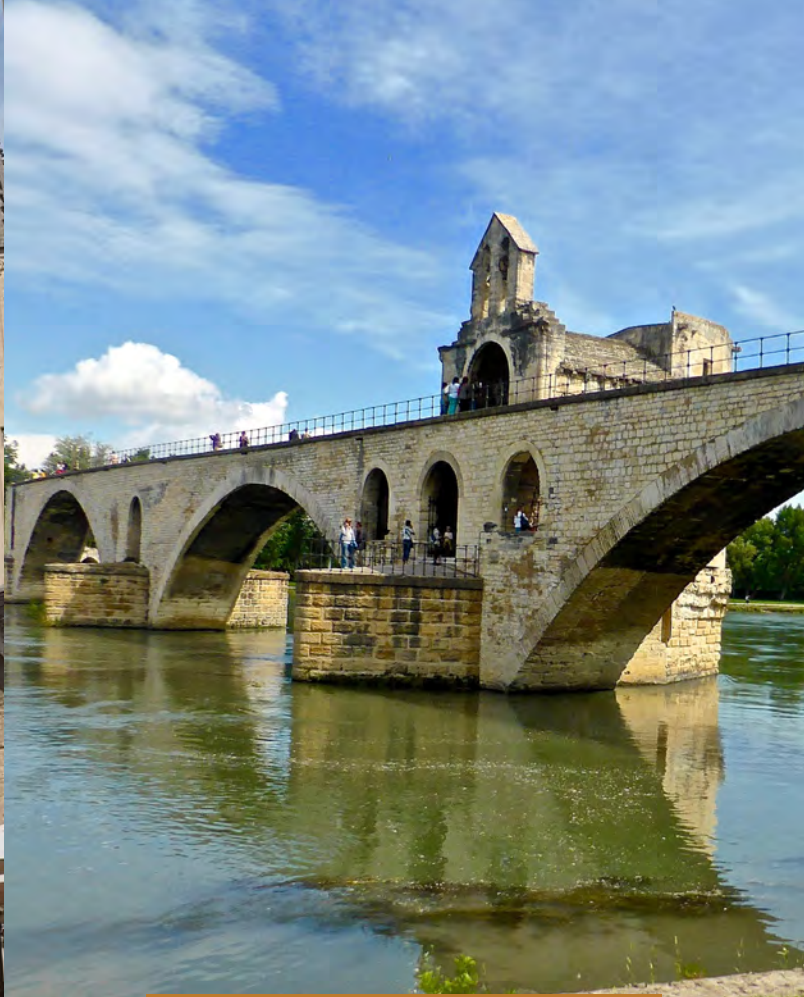
LE PONT BÉNEZET DIT PONT D'AVIGNON