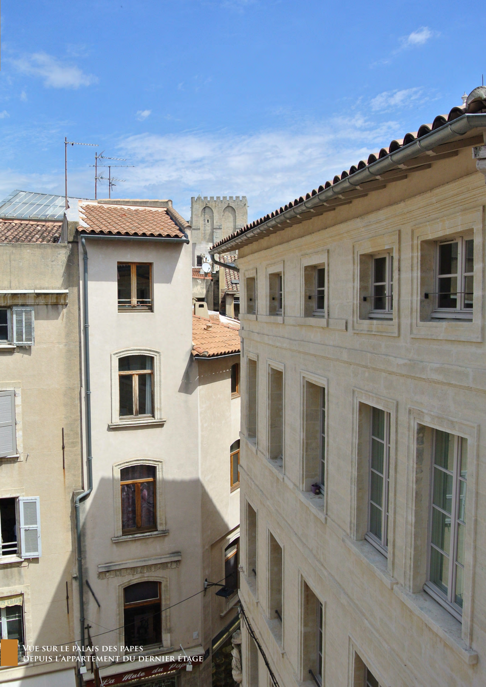
VUE SUR LE PALAIS DES PAPES DEPUIS L'APARTEMENT DU DERNIER ÉTAGE