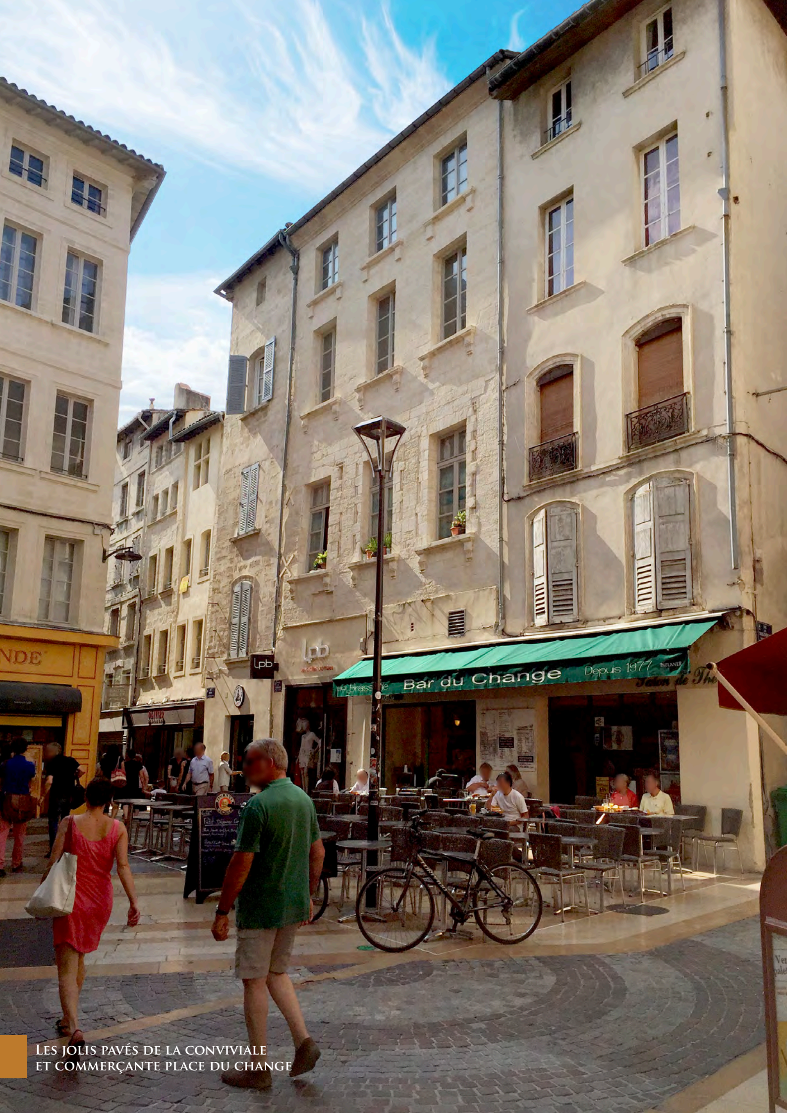
LES JOLIS PAVÉS DE LA CONVIVIALE ET COMMÉRÇANTE PLACE DU CHANGE