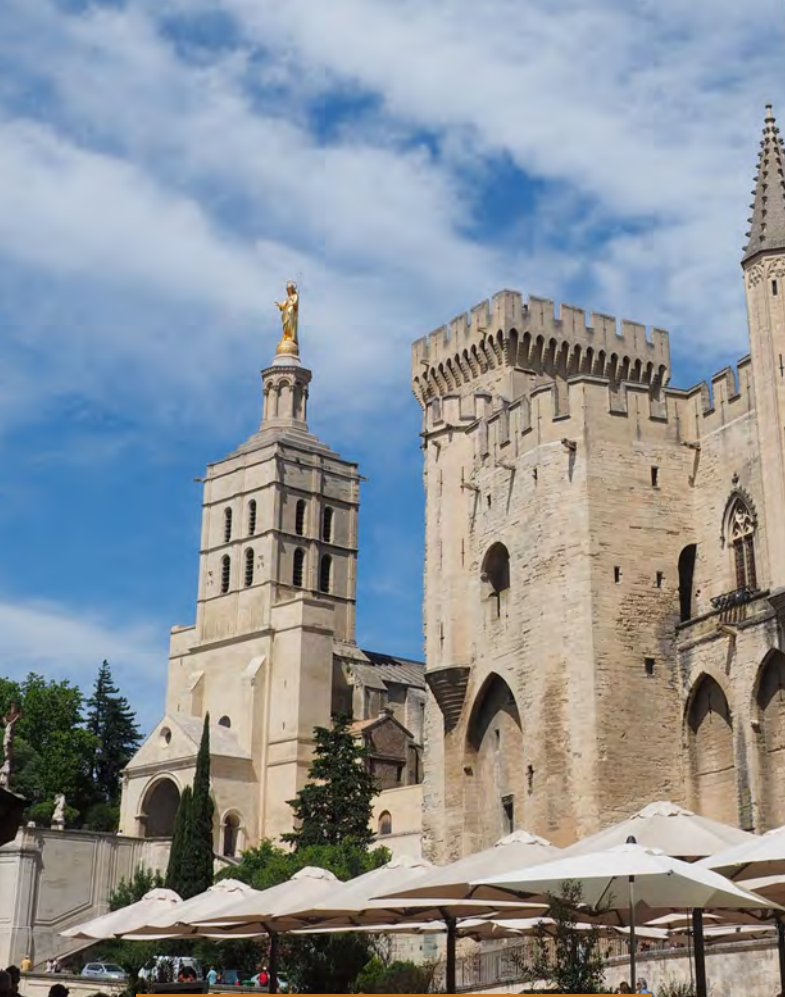
LE PALAIS DES PAPES