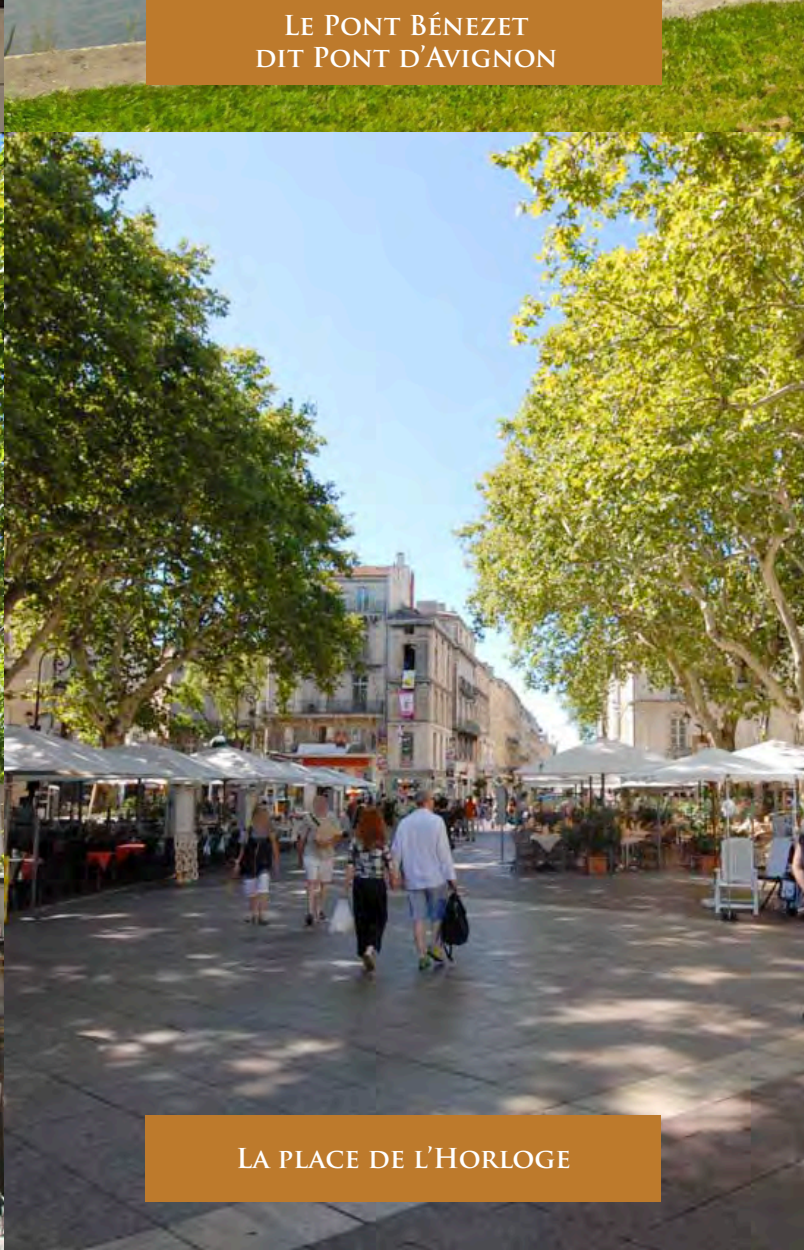
LA PLACE DE L'HORLOGE