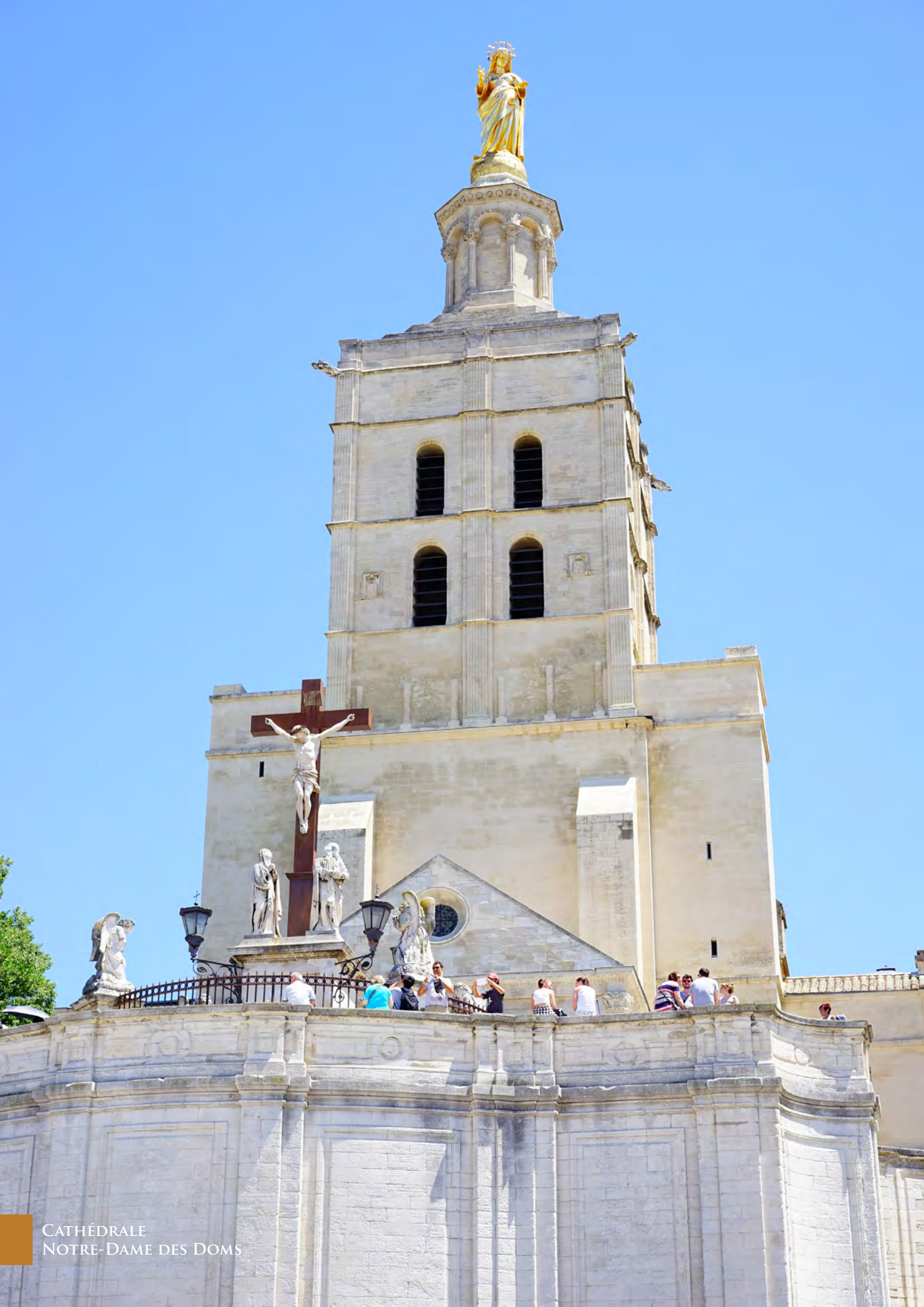
CATHÉDRALE NOTRE-DAME DES DOMS